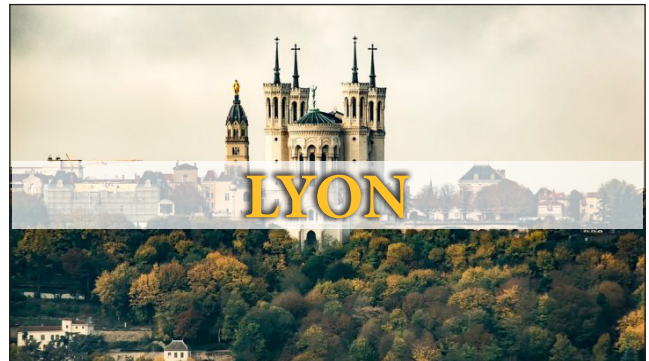
-$- Mardi 25/01 à 11h00 -$-