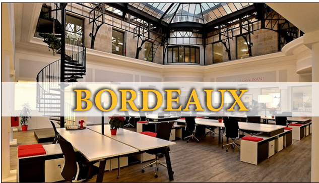
-$- Jeudi 20/01 à 11h00 -$-