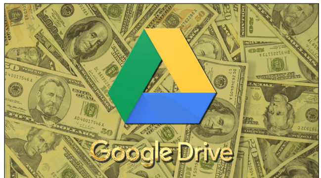
-$- « Tu veux du bif', checke ton débrief' ! » -$-