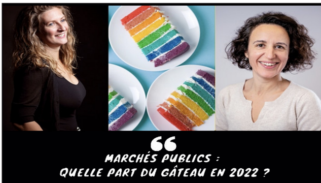
-$- Middlesphère - 03/02 à 11h00 -$-